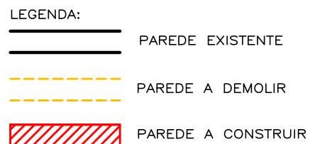
PLANTA BAIXA ESCALA 1:25