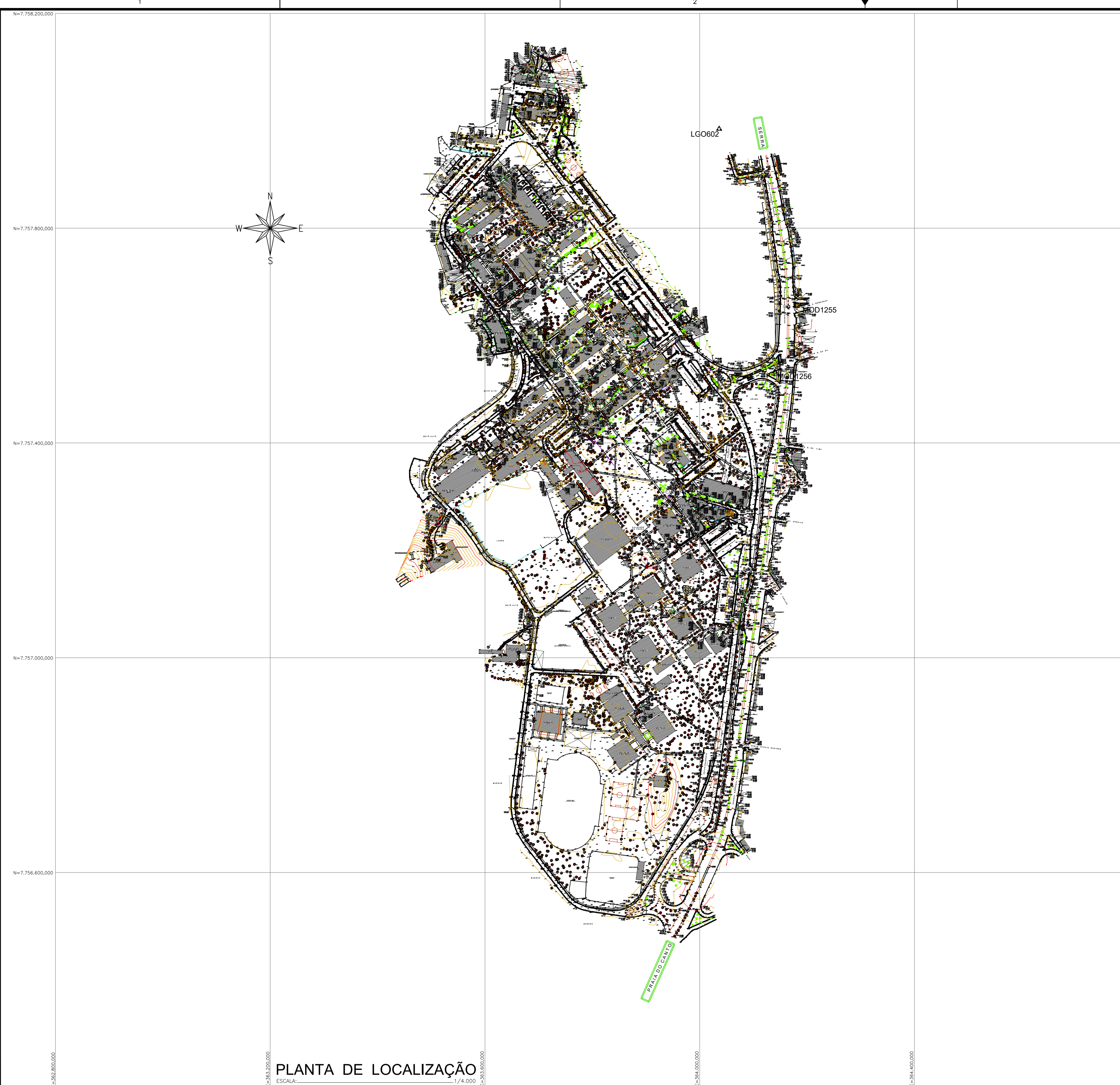
PLANTA DE LOCALIZAÇÃO ESCALA: 1/4.000

CONFIGURAÇÃO DE PENAS P/ FOLHA PEN - COR - ESP 1 7 0,1 2 7 0,2 3 7 0,3 4 7 0,4 5 7 0,5 6 7 0,6 7 7 0,25 8 7 0,25 9 7 0,15 AS DIMENS PENAS - COR. OBJ. E ESP. 0,15