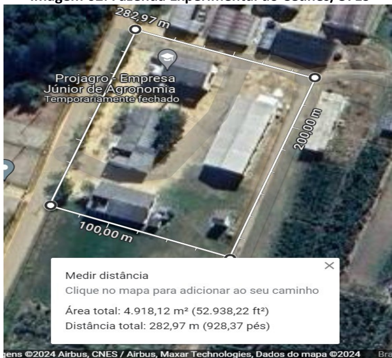
Imagem 02: Fazenda Experimental do Ceunes/UFES